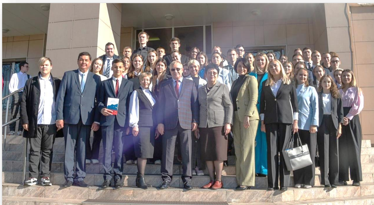
Фото 2. Встреча старшеклассников города Нижнекамска с депутатом Государственной Думы Федерального Собрания Российской Федерации О.В. Морозовым

В рамках подготовки к проведению муниципального этапа Всероссийской олимпиады для школьников по вопросам избирательного права и избирательного процесса «Софиум» старшеклассников Клубом молодых избирателей были организованы и проведены встречи старшеклассников с депутатом Государственной Думы Федерального Собрания Российской Федерации Олегом Викторовичем Морозовым и руководителями территориальных избирательных комиссий города Нижнекамска и Нижнекамского района Республики Татарстан.