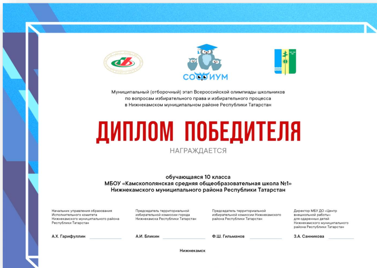
Рис. 7. Образец диплома победителя