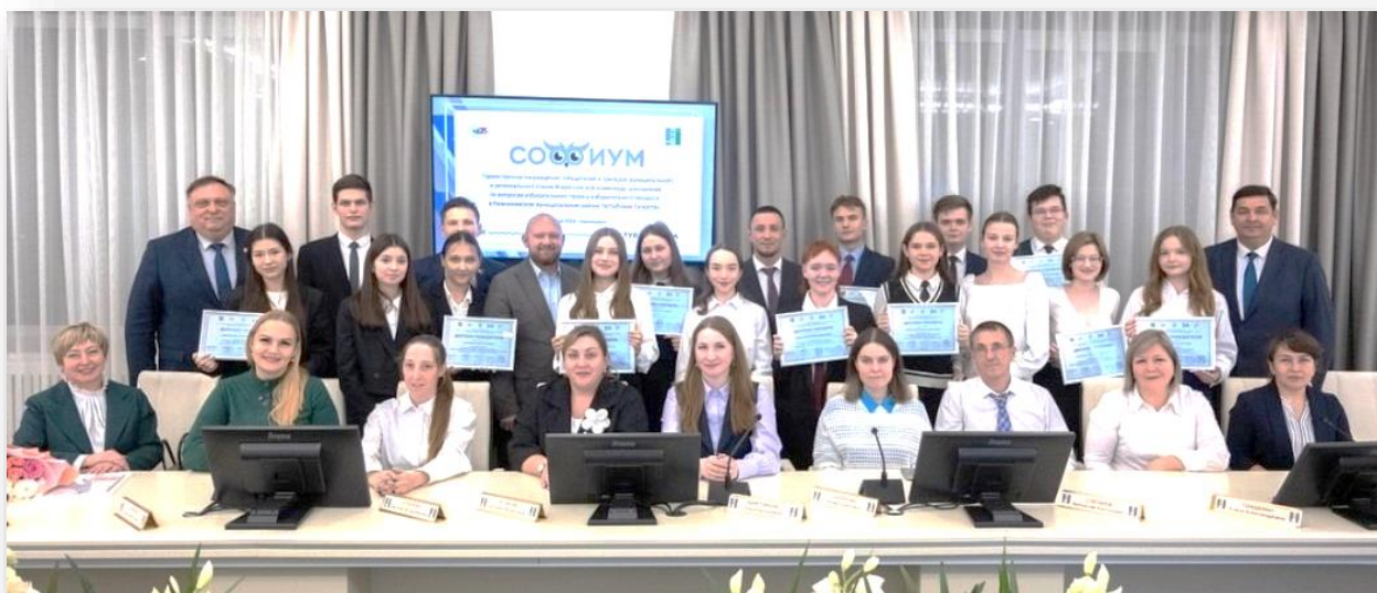
Фото 1. Награждение победителей муниципального этапа Всероссийской олимпиады школьников по вопросам избирательного права и избирательного процесса «Софиум-2024/2025», город Нижнекамск

По инициативе территориальных избирательных комиссий города Нижнекамска и Нижнекамского района Республики Татарстан для старшеклассников образовательных организаций Нижнекамского муниципального района Республики Татарстан был организован и начал проводится с 2022 года муниципальный этап Всероссийской олимпиады школьников по вопросам избирательного права и избирательного процесса «Софиум».