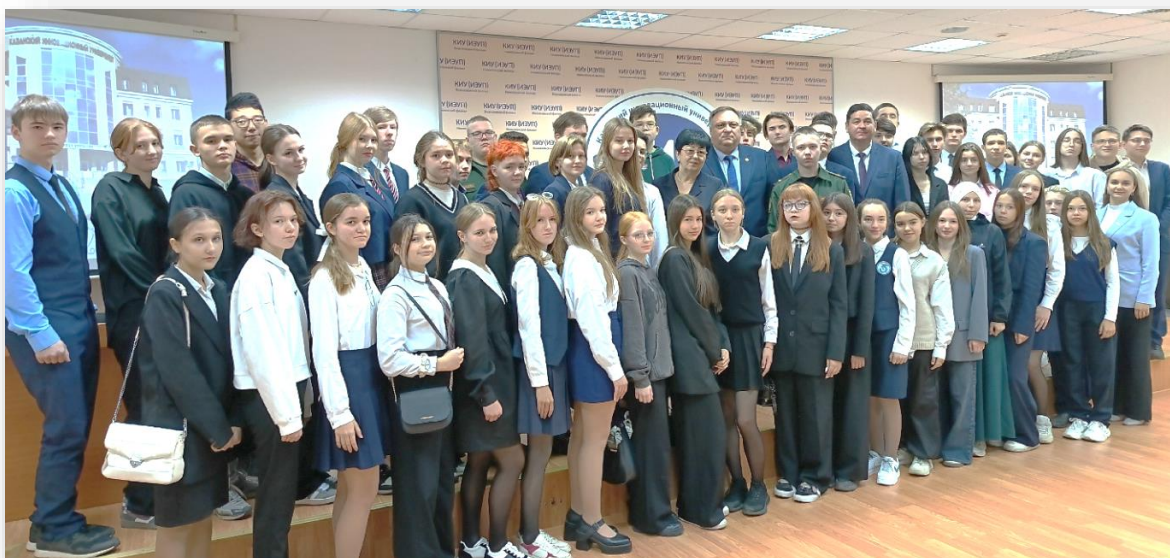
Фото 3. Встреча старшекласников города Нижнекамска с председателем Территориальной избирательной комиссии города Нижнекамска А.И. Бликиным и с председателем Территориальной избирательной комиссии Нижнекамского района Республики Татарстан Ф.Ш. Гильмановым

Объективным показателем эффективности организации и проведения муниципального этапа Всероссийской олимпиады для школьников по вопросам избирательного права и избирательного процесса являются победы старшекласников города Нижнекамска и Нижнекамского района Республики Татарстан на региональных и всероссийских этапах данной олимпиады.